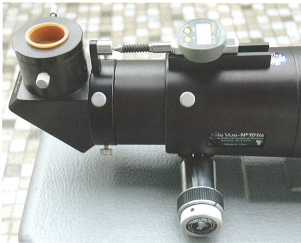
Gros plan sur le comparateur Sylvac pour la mesure de l'amplitude du porte oculaire et sur le mécanisme de mise au point démultipliée Focusmate.

Au paragraphe des réclamations nous avons: Le bouton du focusmate qui défigure l'instrument telle une verrue,